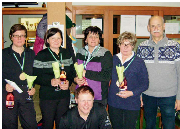
Die Sieger vom Gemeindeturnier der Damen: „Die Dorfbäuerinnen“.