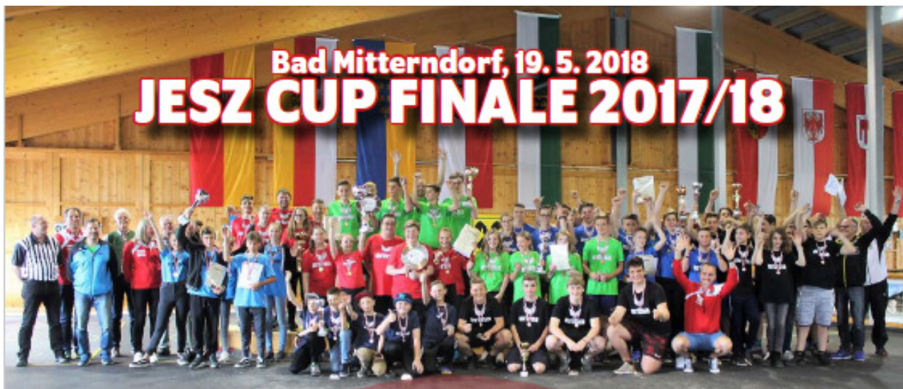
Finale im JESZ CUP 2017/18 in Bad Mitterndorf - alle Teilnehmer und Betreuer gemeinsam auf einem Bild.