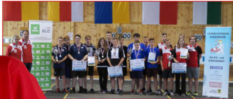
Podium bei den Österreichischen Meisterschaften der U19 im Stocksportzentrum des ESV Bad Mitterndorf - LV Tirol (Mitte) vor ESV Hausmannstätten (l) und LV NO (re).

11 Mannschaften (5 Vereinsmannschaften, 6 Landesauswahlen) spielten Ende Juni 2018 in Bad Mitterndorf um den Österreichischen Titel in der Jugendklasse U19. Es blieb spannend bis zur letzten Runde; mit 16 Punkten holte sich die Auswahl des Landesverbandes den Meistertitel in der